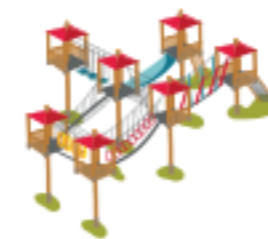
Detský lanový park